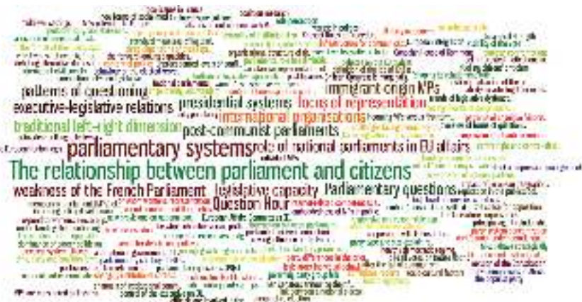
3. ábra In vivo kódok a szövegekben (JLS)