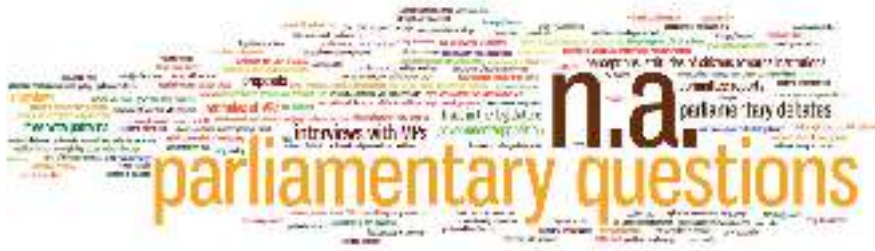
9. ábra Az adatforrások gyakorisága (JLS)