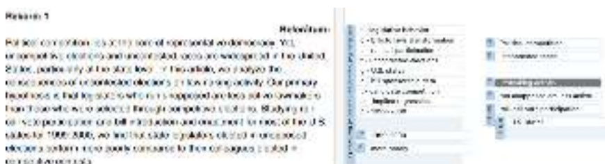
1. ábra Egy abstract ATLAS.ti kódjai

Az ábrán látható, hogy a két kódolási megoldás (változókra épülő, illetve in vivo ) eredménye jól elkülöníthető az egyes változókat jelző kód-kezdő betűk segítségével (ld. t – topic = téma; m – methods = módszertan; d – data source = adatforrás; g – geography/institution = földrajz/intézmény; p – period = időszak). Az 1. táblázat a minta néhány dokumentuma esetében mutatja be az így meghatározott eljárás eredményét.