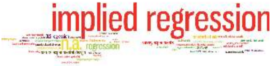
6. ábra A használt módszertanok gyakorisága (LSQ)

E nehézség ellenére az abstract ok sok esetben tartalmaznak utalásokat a cikk kvantitatív jellegére. Ilyen az amikor „kontroll változóról” van szó, vagy amikor a nyelvezetből általában sejthető, hogy regressziós vizsgálatot folytat le a tanulmány. Egyetlen példát említve: amikor egy összefoglaló számos más oksági összefüggés bevezetése mellett arról ír, hogy az adott évi „kormányzói választások [...] befolyásolják a költségvetési módosító indítványok beadását”, akkor az „influence” kifejezés az adott szövegkörnyezetben nyilvánvalóan egy regressziós eredményre utal. Ezekben az esetekben az adott tételt az „implicit regresszió” kategóriába soroltuk. E döntés jelentőségét jelzi, hogy az összes módszertani kód közül ez hozta messze a legtöbb „találatot” (amit jól jelez a szó-gyakoriságra épülő 6., illetve 7. ábra).