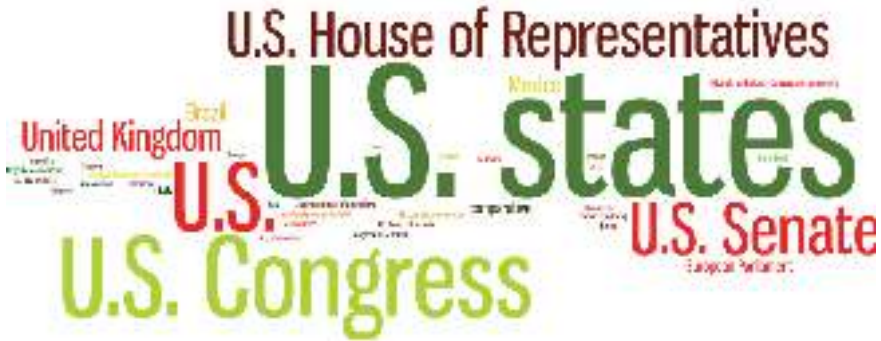
10. ábra A vizsgálat földrajzi fókuszának gyakorisága (LSQ)