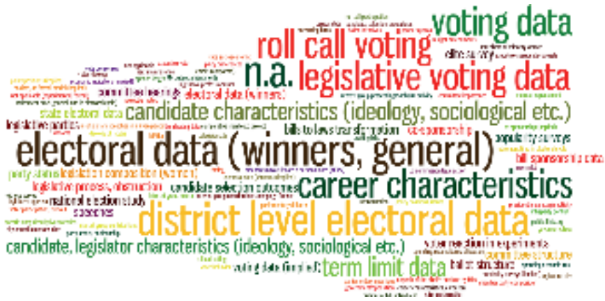
8. ábra Az adatforrások gyakorisága (LSQ)