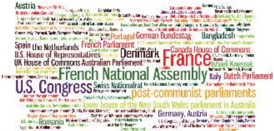
11. ábra A vizsgálat földrajzi fókuszának gyakorisága (JLS)