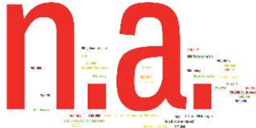
12. ábra A vizsgált időszakok gyakorisága (LSQ)

kevés a csak néhány éves periódust vizsgáló esettanulmány. Ezek ugyanakkor több esetben sajátosan Nagy-Britannia politikatörténetéhez, ezen belül is a választási reformokhoz kapcsolódtak. Az ilyen jelentős intézményi változtatásokat több esetben mint természetes kísérletet fogták fel, ennyiben az évszám adatok kissé megtévesztőek: valójában az adott évszámot megelőző és az azt követő időszakról szól a vizsgálat.