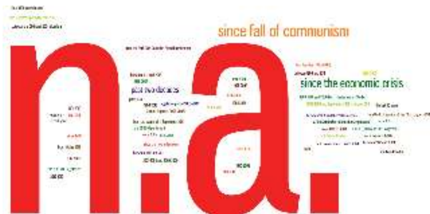
13. ábra A vizsgált időszakok gyakorisága (JLS)