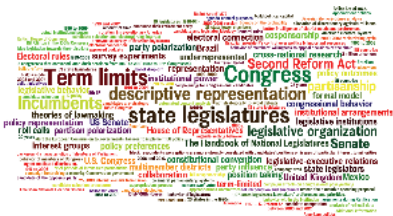
2. ábra In vivo kódok a szövegekben (LSQ)